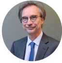
Yves DUBIEF Président de l'Union des Industries Textiles